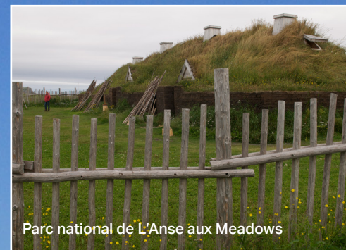
Parc national de L'Anse aux Meadows