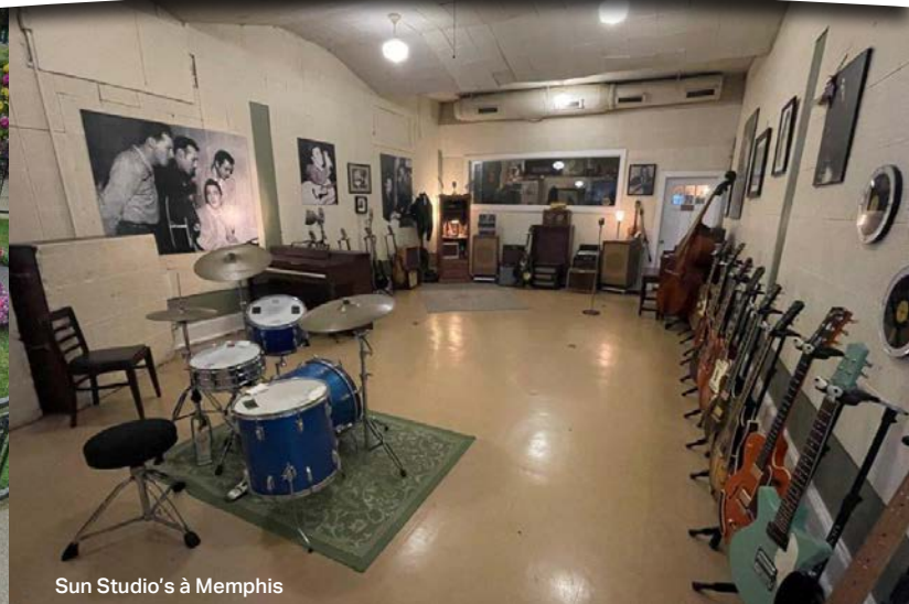
Sun Studio's à Memphis