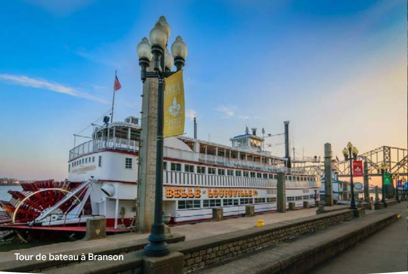
Tour de bateau à Branson