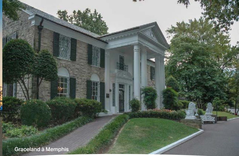
Graceland à Memphis

centre commercial , qui est également un centre d'attraction de Nashville , où vous trouverez de quoi satisfaire tous vos goûts. Après un souper de groupe , nous assisterons à une performance au renommé Grand Ole Opry , qui sera un moment marquant de notre voyage . Tout chanteur rêve d'y donner un spectacle au moins une fois dans sa carrière . Le Grand Ole Opry est le lieu sacré , ainsi que le temple de la musique country , et nous aurons la chance de voir au moins une demi-douzaine d'artistes se donner en spectacle . Une soirée mémorable! PD - D - S