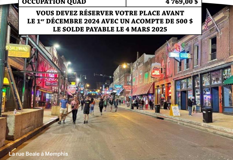
La rue Beale à Memphis

VOUS DEVEZ RÉSERVER VOTRE PLACE AVANT LE 1 er DÉCEMBRE 2024 AVEC UN ACOMPTE DE 500 $ LE SOLDE PAYABLE LE 4 MARS 2025