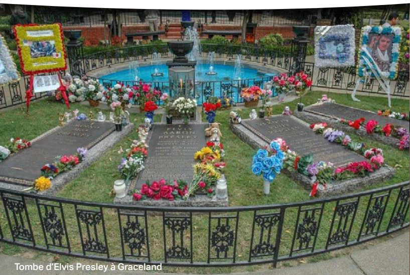
Tombe d'Elvis Presley à Graceland