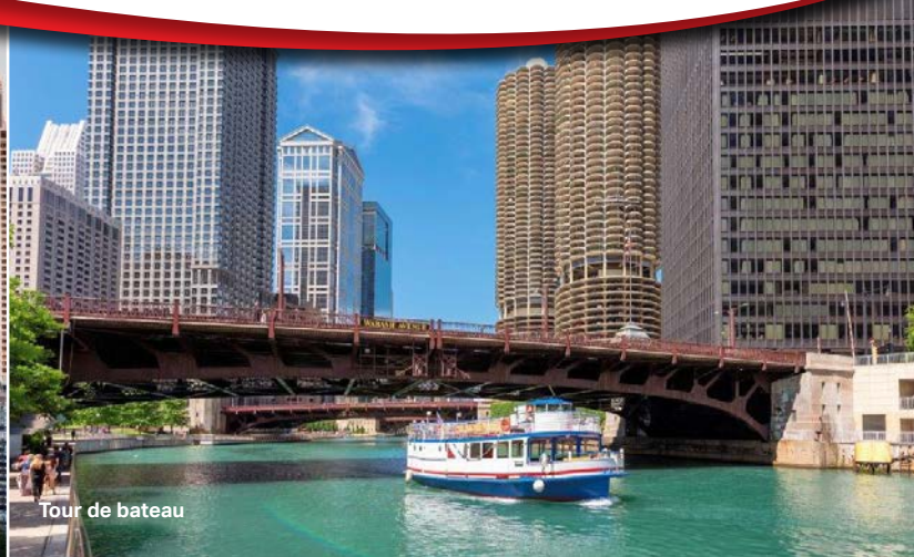
Tour de bateau