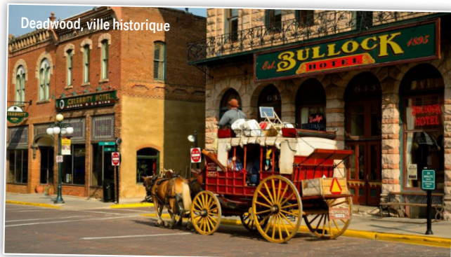
Deadwood, ville historique

Après le petit-déjeuner et avoir fait la grasse matinée, nous irons visiter un musée souvent identifié comme le Smithsonian du Mid-Ouest : le Buffalo Bill Historical Center . La petite ville de Cody a d'ailleurs été nommée en