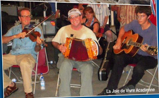
La Joie de Vivre Acadienne

site. Le musée offre alors une multitude d'objets authentiques reliés au Titanic, notamment les souliers d'un jeune garçon qui n'a pu être identifié, surnommés par conséquent « les souliers inconnus ». Nous pourrions également nous assoir sur une reproduction exacte d'une chaise de parterre de bois que l'on trouvait sur le pont du Titanic. Nous pourrions admirer une photo retrouvée du grand escalier principal du navire et plusieurs autres objets. Le musée raconte aussi la tragique explosion d'Halifax du 6 décembre 1917. Alors que le Canada était au cœur de la Première Guerre mondiale, une explosion tua à Halifax 2 000 personnes et en blessa plus de 9 000. Une grande partie de la ville fut détruite. Somme toute, vous y trouverez assurément une exposition qui vous intéressera. De retour à l'hôtel et reste de la journée libre. PD