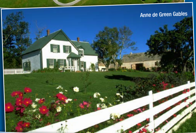
Anne de Green Gables