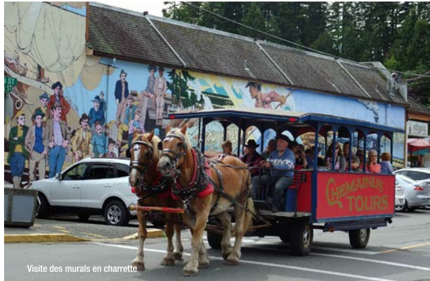
Visite des murals en charrette