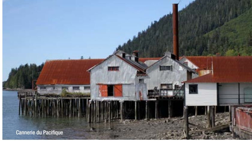
Canneries du Pacifique