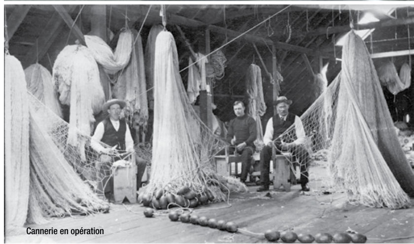
Canneries en opération