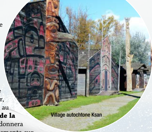
Village autochtone Ksan

phoques et les otaries . Le capitaine et le naturaliste à bord nous renseigneront sur ces impressionnants animaux et seront en mesure de répondre à toutes nos questions. De retour au quai vers 16 h 30, tout à fait éblouis par notre excursion. Avant le souper, nous ferons une visite au centre d'interprétation de la baleine . Notre guide nous donnera une multitude de renseignements sur ces plus gros mammifères et nous aurons la chance de voir les squelettes d'un épaulard, d'une baleine, d'une otarie et autre. Avant de reprendre la route, nous aurons droit à un succulent souper au saumon frais du Pacifique cuit sur le BBQ . Un vrai délice! Nous arriverons à notre hôtel situé au cœur de Campbell River en milieu de soirée. PD - D - S