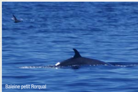
Baleine petit Rorqual