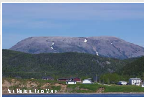
Parc National Gros Morne