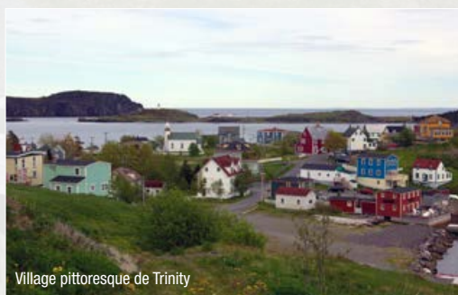
Village pittoresque de Trinity

Une visite à St-John n'est pas complète sans un arrêt au musée The Rooms . Ce musée est une vitrine sur la vie des gens de qui vivent ici et leurs