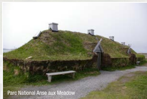
Parc National Anse aux Meadows