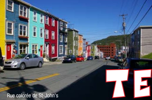
Rue colorée de St-John's