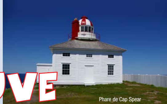
Phare de Cap Spear