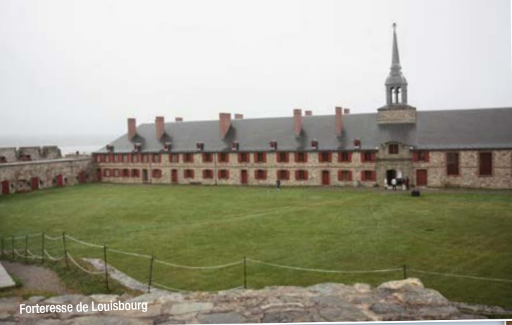
Forteresse de Louisbourg