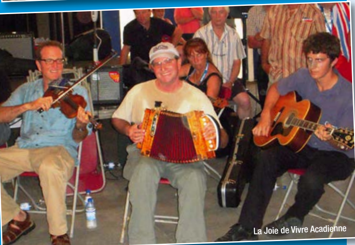
La Joie de Vivre Acadienne