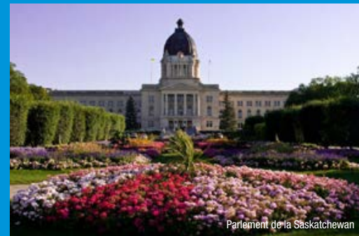
Parlement de la Saskatchewan