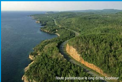
Route panoramique le long du lac Supérieur