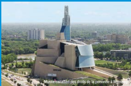
Musée canadien des droits de la personne à Winnipeg