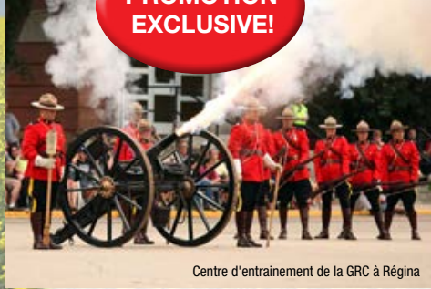
Centre d'entraînement de la GRC à Régina