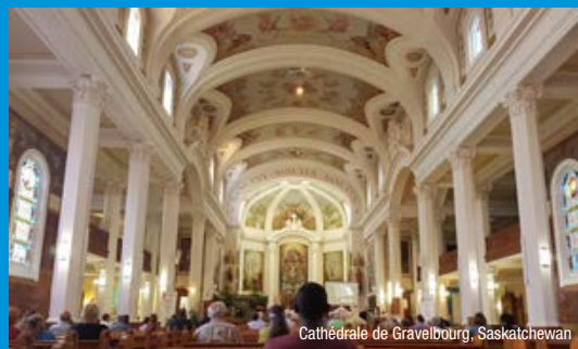
Cathédrale de Gravelbourg, Saskatchewan