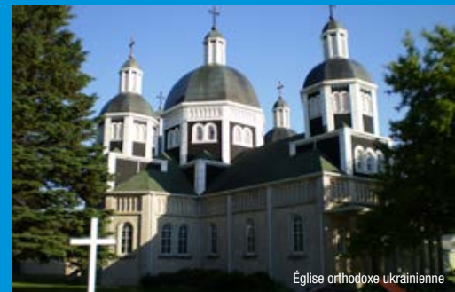
Église orthodoxe ukrainienne