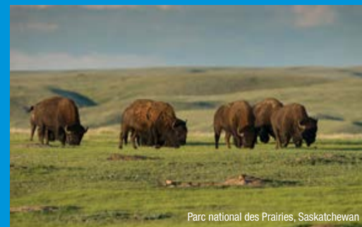
Parc national des Prairies, Saskatchewan