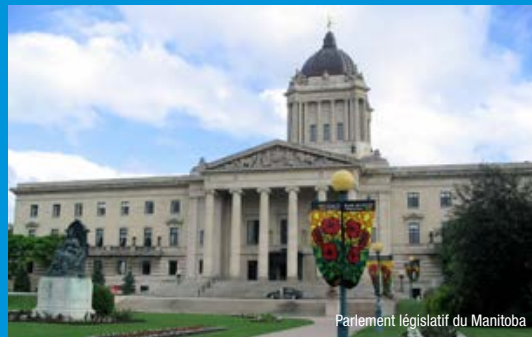
Parlement législatif du Manitoba