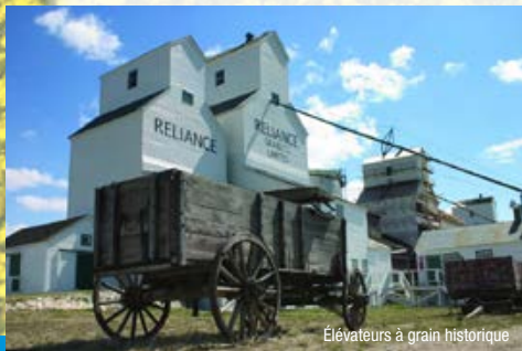
Élévateurs à grain historique