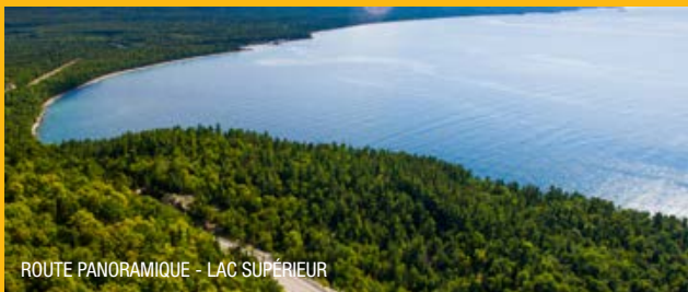
ROUTE PANORAMIQUE - LAC SUPÉRIEUR